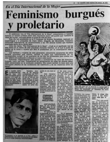
El Diario, 8 de marzo de 1988, Lima.