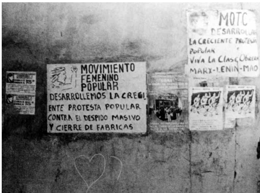
Cartel del Movimiento Femenino Popular, extraído del libro de Carol Andreas, When Women Rebel. The Rise of Popular Feminism in Peru , 1986.

mos Generados fueron el Movimiento de Obreros y Trabajadores Clasistas (MOTC), el Movimiento de Campesinos Pobres (MCP); el Movimiento Clasista Barrial (MCB); el Frente Estudiantil Revolucionario (FER); el Frente Revolucionario Estudiantil Secundario (FRES), y el Movimiento Femenino Popular (MFP).