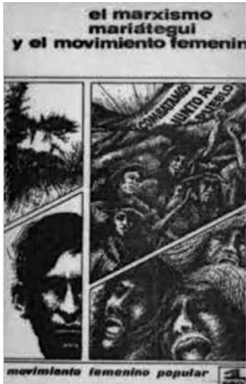
Carátula original del libro "El marxismo, Mariátegui y el Movimiento Femenino", 1974.