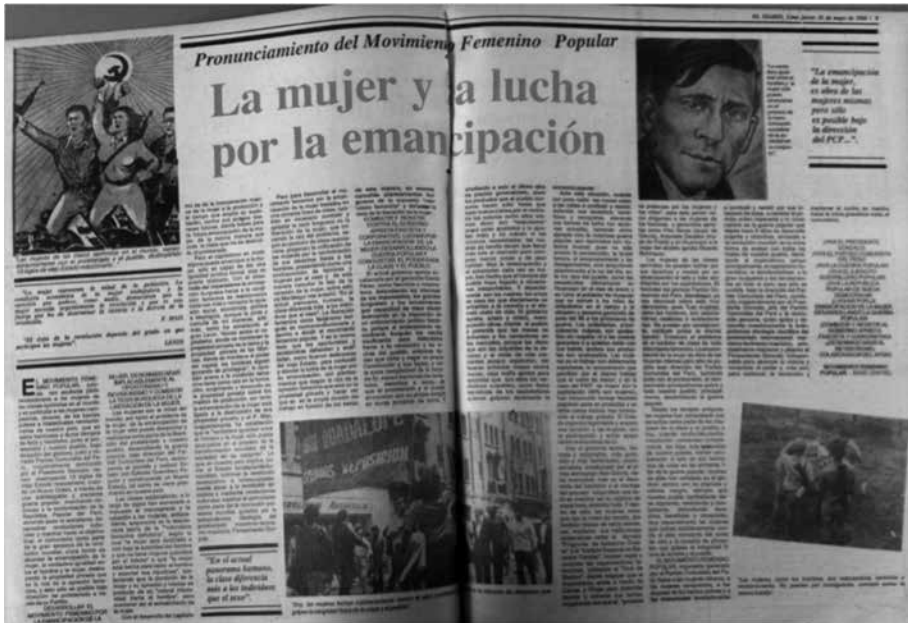
Pronunciamiento del Movimiento Femenino Popular, El Diario , 26 de mayo de 1988, Lima.